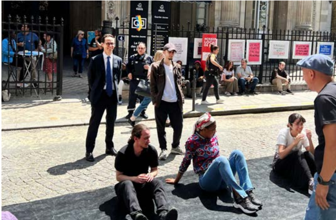
Inauguration des quartiers d'été de la mission locale de Paris par Christophe Noël du Payrat, préfet, directeur de cabinet du préfet de région

Tout au long de l'été, en Île-de-France, l'État s'engage auprès des habitants des quartiers prioritaires de la politique de la ville (QPV) et soutient le déploiement de nombreux projets, en particulier en direction des jeunes. En 2023, dans la perspective des jeux Olympiques et Paralympiques, l'État porte une attention renforcée aux projets et aux événements permettant aux habitants des QPV de participer à la dynamique des JOP.